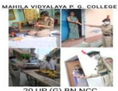
20 UP (G) BN NCC